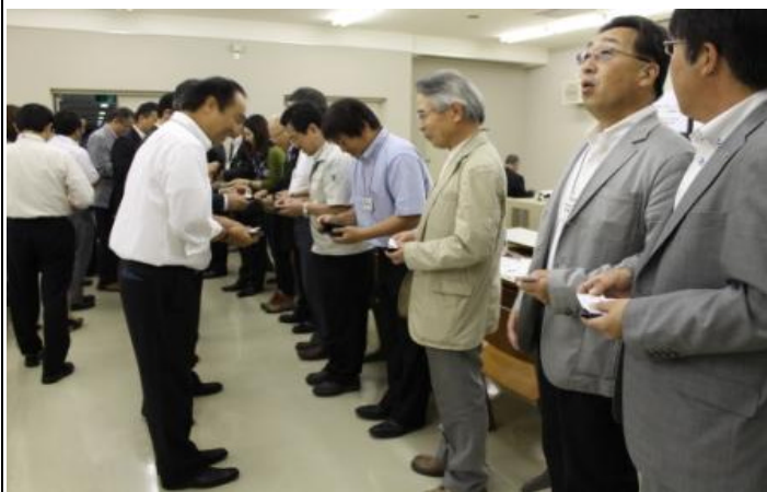
経営道フォーラム第 49 期生(17 名)と参加地元企業経営者(17 名)との名刺交換が行なわれました。