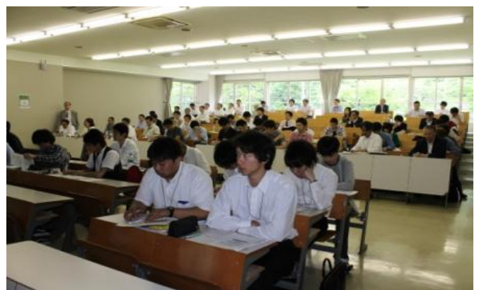
地元企業経営者・石巻専修大学生が熱心に聴講しました。