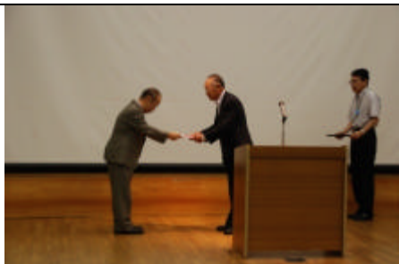
22年度研究奨学金110万円贈呈 4名の研究員が決定しています