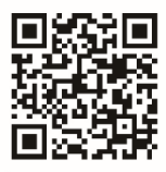
特殊詐欺対策ページ で詳細をチェック！