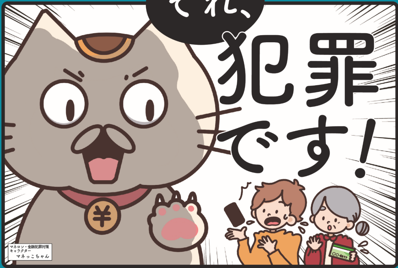
マネロン・金融犯罪対策 キャラクター マネっちゃん