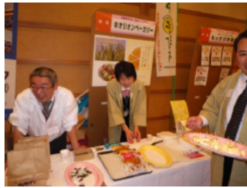
花巻信金様 出展企業