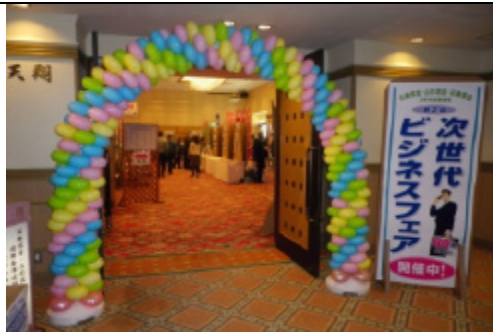
フェア会場入場口