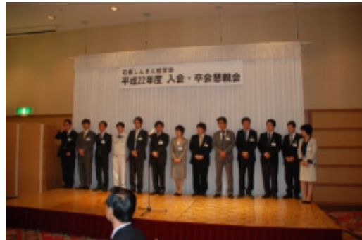
平成22年度 入会者挨拶