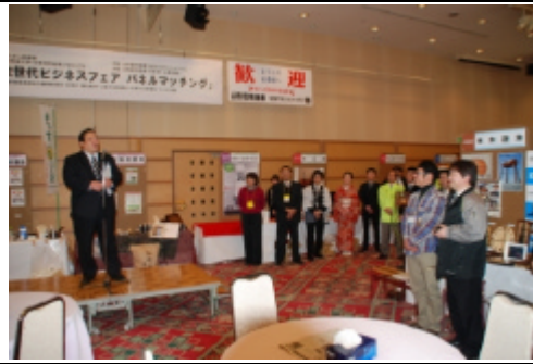
閉会挨拶 (熊倉交流グループリーダー)

当日の来場者は約700名で、塾生企業の事業内容を広く知ってもらい良い機会となり、また、一般企業12社の出展、山形信用金庫様と花巻信用金庫様の紹介企業が出展したことにより、商談件数実績は105件でした。