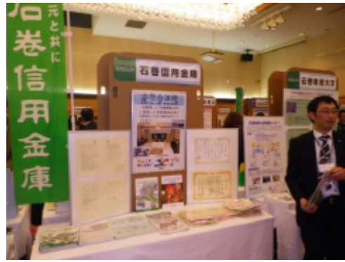
産学金連携の紹介(くらしの相談課)