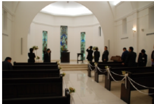
「迎賓館チャペル」見学風景