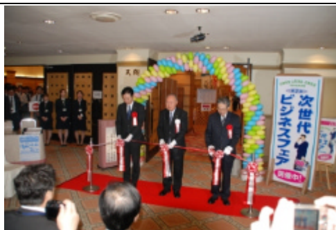
テープカット風景