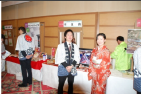
山形信金様 出展企業