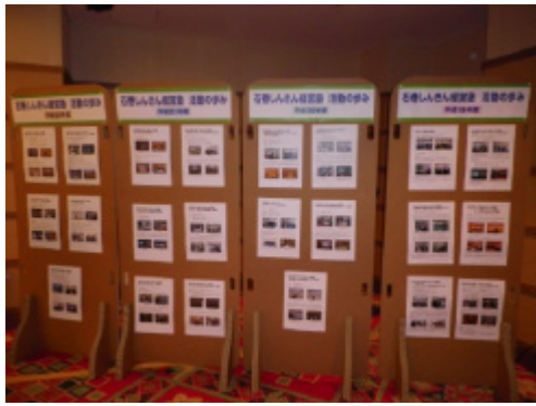
石巻しんきん経営塾の歩みを紹介