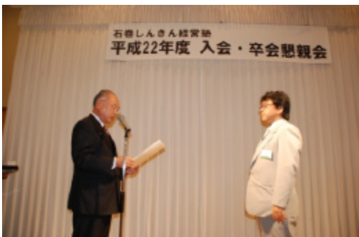
第1回卒業生 卒業証書授与