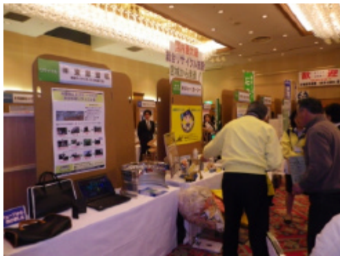
経営塾生企業展示