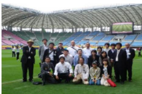
スタジアム内で記念撮影

最後に、「いにしへの道を聞いても唱えても、わが行いにせずば甲斐なし」を経営者へのメッセージとしていただきました。