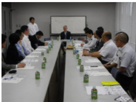
伊藤委員長による講師紹介