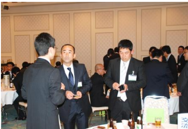
名刺交換「よろしくお願いします。」