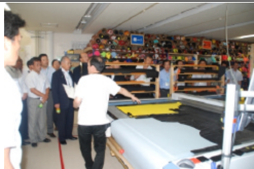
(株)ムービーディック 視察