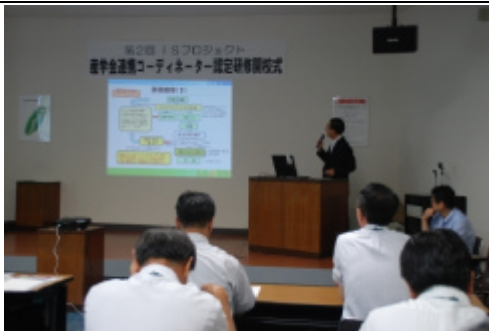
講演(みやぎ優れ MONO 発信事業について)