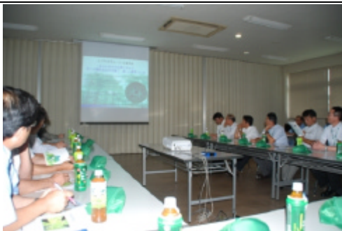
(株)東北イノアック小牛田工場 視察