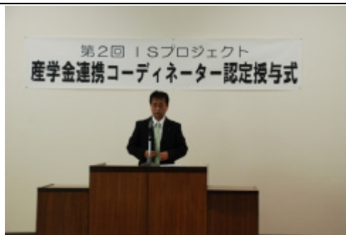
「レポート発表」 渋谷支店長