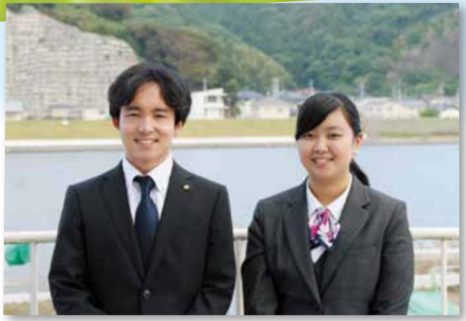
2020 NEW FACE