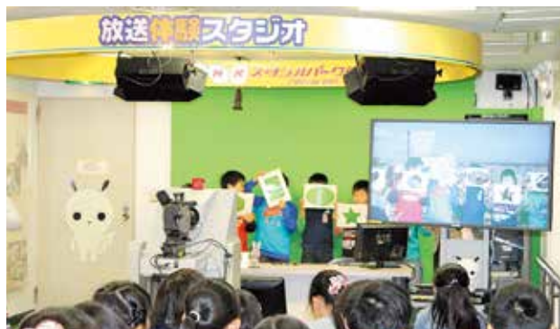
NHK仙台放送局で、スタジオ内の見学や放送技術を体験しました。