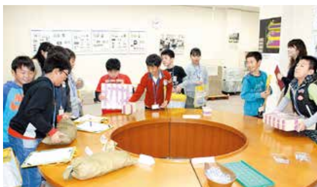
日本銀行仙台支店を見学し、お札の偽造防止技術の確認や1億円の重さ体験を行いました。