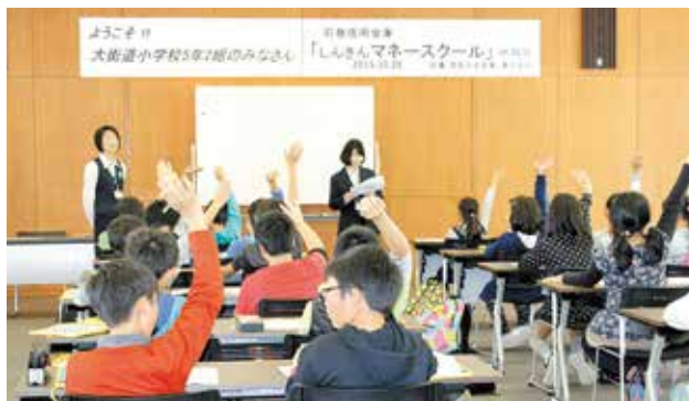
金融機関の種類と仕事、お金の大切さについて、信金中央金庫東北支店で「しんきんマネースクール」を実施しました。

「金融知識の習得」と「お金の大切さ」を知ってもらい、地域社会へ貢献することを目的として、石巻市立大街道小学校の児童を仙台に招待し、「しんきんマネースクール」を行い、また「NHK仙台放送局」と「日本銀行仙台支店」を見学しました。