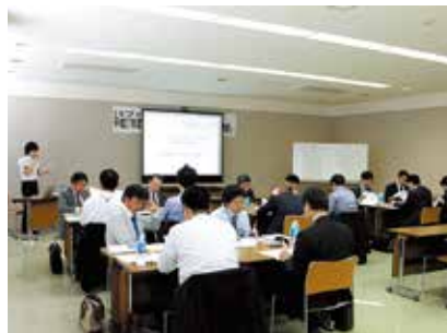
「信用金庫へのニーズと課題」「理想の信用金庫をつくる」をテーマにグループワークを行い、「理想の信用金庫をつくる」について発表しました。