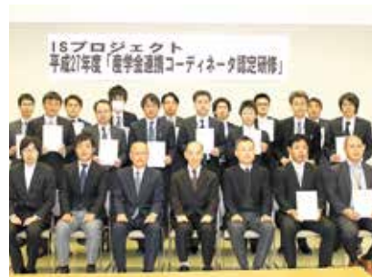
受講者16名全員に修了証書が授与されました。